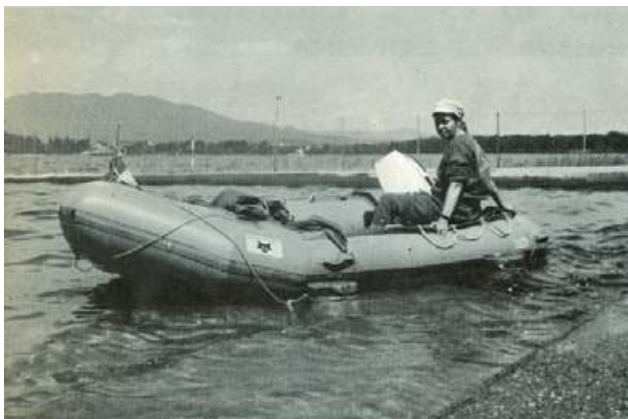
Un canotto da turismo veloce della DO.MAR: il Modello 375, di colore rosso arancio, per assicurare una migliore visibilità.